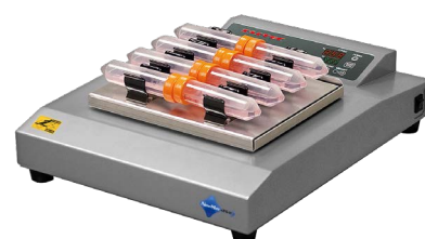
EVR-104 (振とう台[別売]使用例)