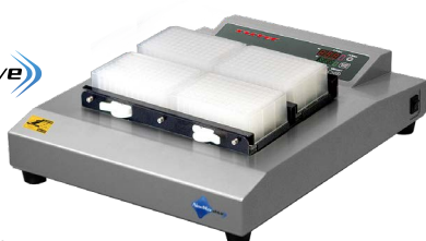
EVR-034 (ディープウェル使用例)