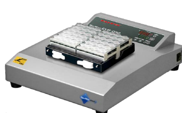
EVR-032 (マイクロチューブラック[別売]使用例)