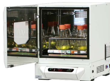
実験台の下にも置きやすいフロントドア (別売のスプリングネット振とう台使用例)